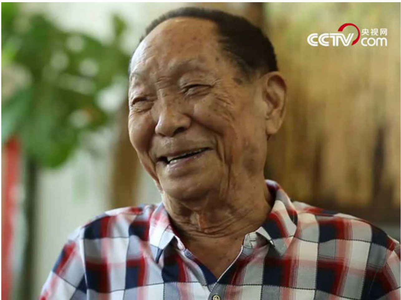
资料图：袁隆平

记者连线了在现场的国家杂交水稻工程手艺研究中央研究员宋春芳。他先容，品种整个生育期体现优秀，10月5日开端实收测产数据显示，亩穗数19.5万，成穗率78.6%，每穗粒总数304粒，结实率90%，千粒重25.5克，穗粒数273.6粒，展望亩产理论产量在1357.4公斤。